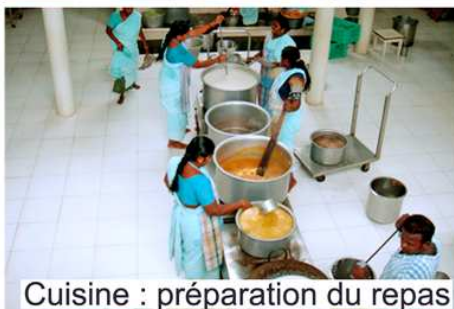
Cuisine : préparation du repas