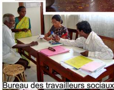
Bureau des travailleurs sociaux