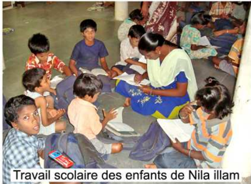
Travail scolaire des enfants de Nila illam