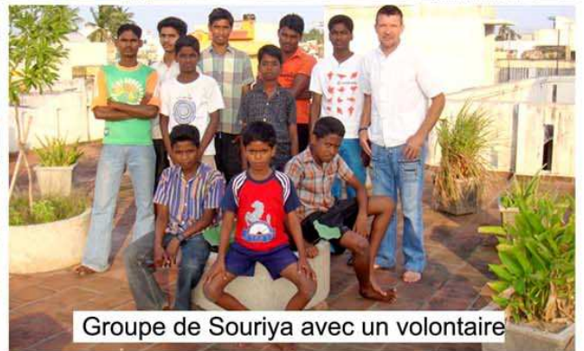
Groupe de Souriya avec un volontaire