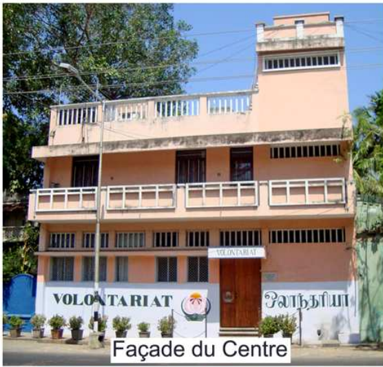
Façade du Centre