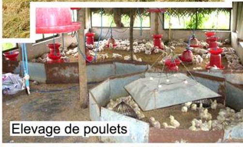
Elevage de poulets