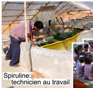
Spiruline: technicien au travail