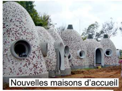
Nouvelles maisons d'accueil