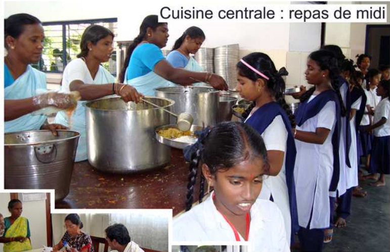
Cuisine centrale : repas de midi