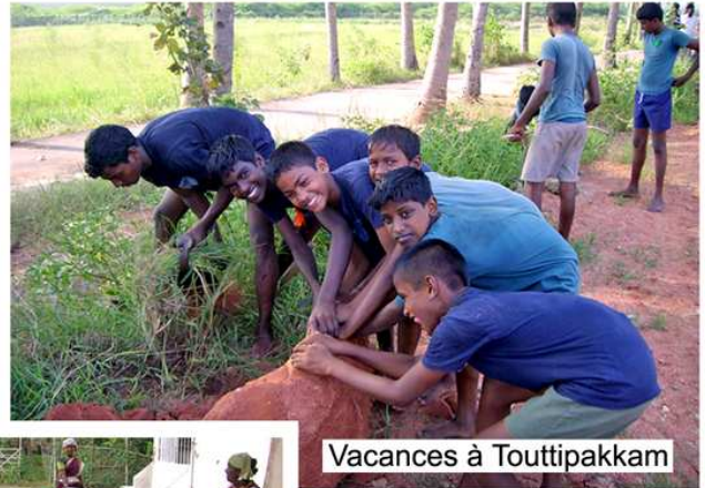
Vacances à Touttipakkam