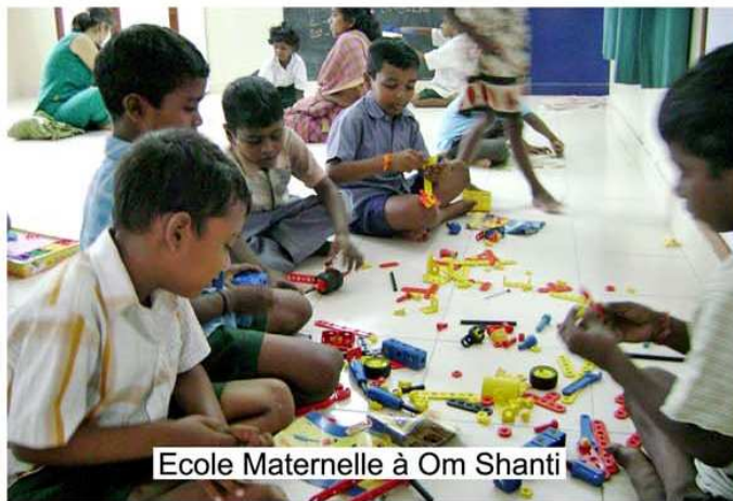
Ecole Maternelle à Om Shanti