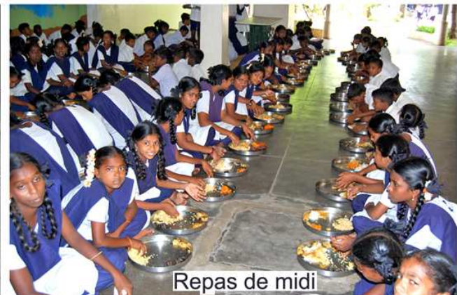
Repas de midi