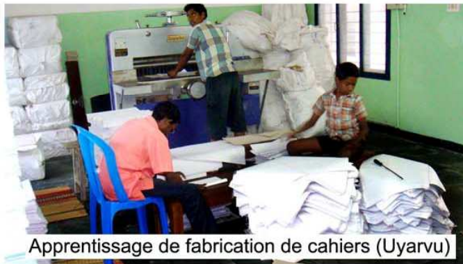
Apprentissage de fabrication de cahiers (Uyarvu)