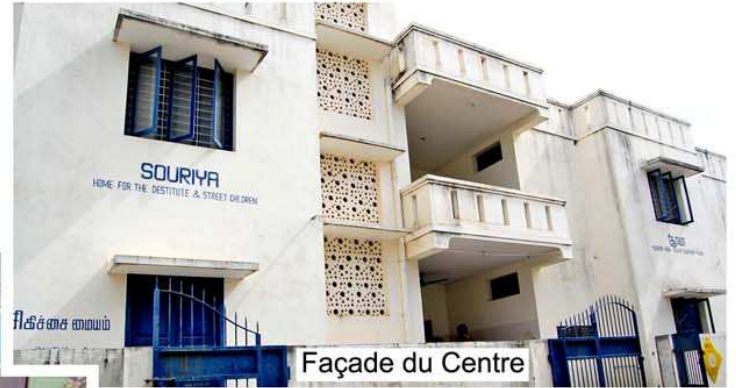
Façade du Centre