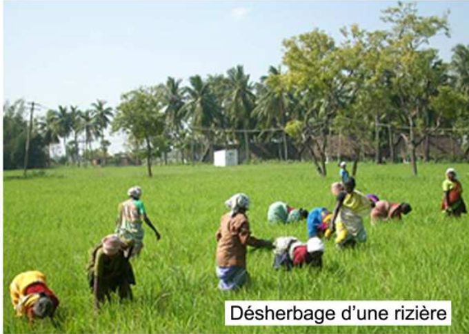
Désherbage d'une rizière