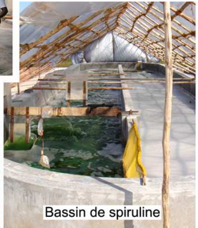
Bassin de spiruline