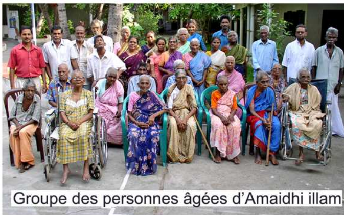
Groupe des personnes âgées d'Amaidhi illam