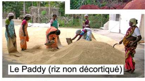
Le Paddy (riz non décortiqué)