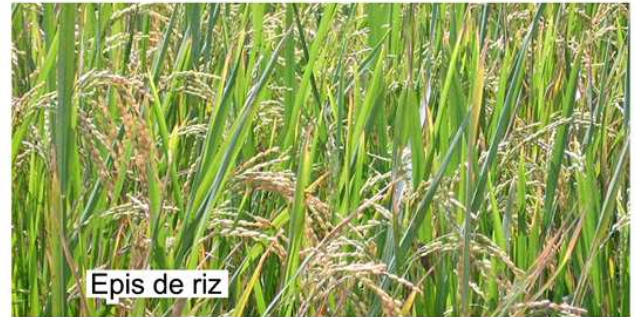
Epis de riz