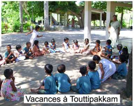
Vacances à Touttipakkam